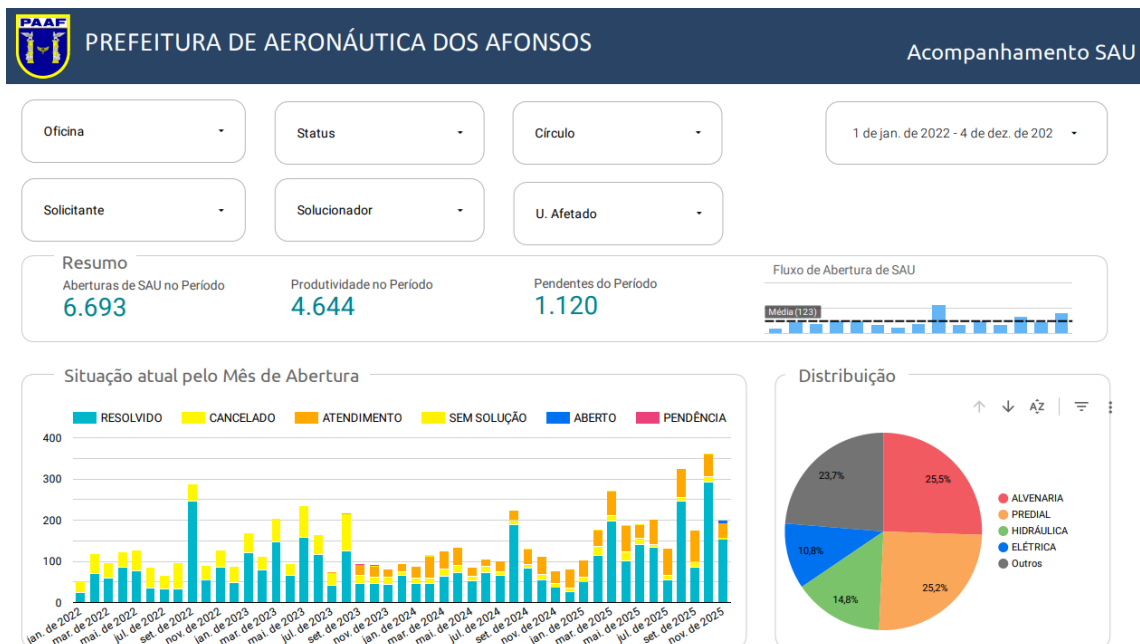
FIGURA 2 – Chamados SAU resolvidos pelo INTERNALIZAR – 2022 à 2025